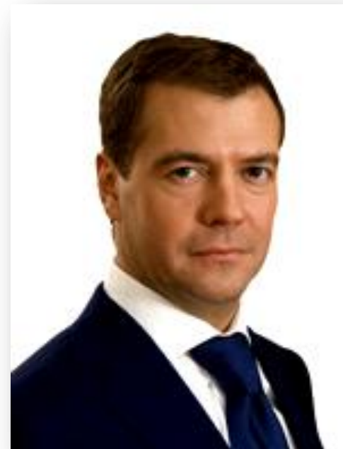
Д.А.Медведев Третий Президент РФ май 2008 - май 2012