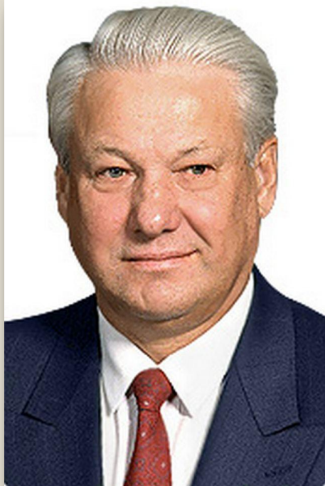
Б.Н.Ельцин Первый Президент РФ июнь 1991- декабрь 1999 гг.