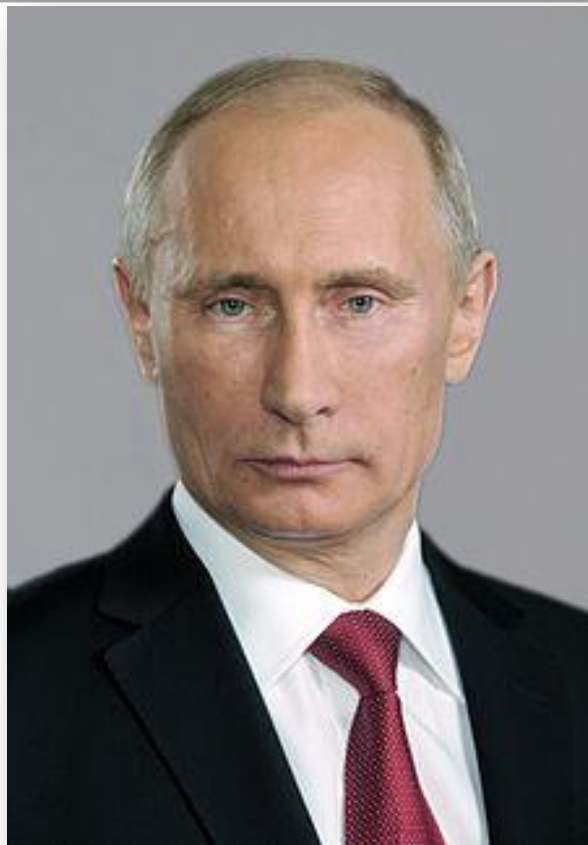
В.В.Путин Второй и четвертый Президент РФ март 2000-май 2008 гг. май 2012 – действующий Президент